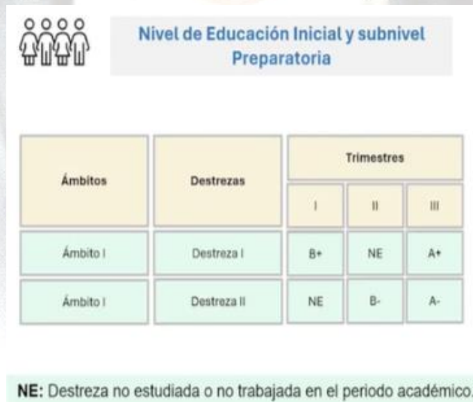
Figura 3. Niveles de Educación y su forma de Evaluación